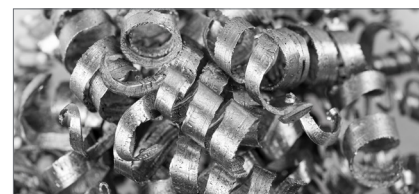
Ingegneria di primo stadio

Lo sapevi che offriamo servizi di ingegneria di primo stadio per accelerare i tuoi processi?.